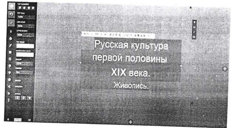
Рисунок 1 – Один из этапов разработки презентации в Slides